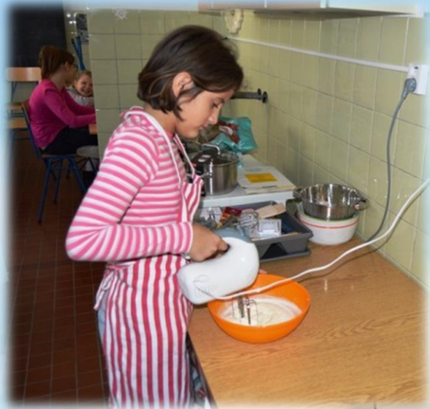
Miláčik a puding